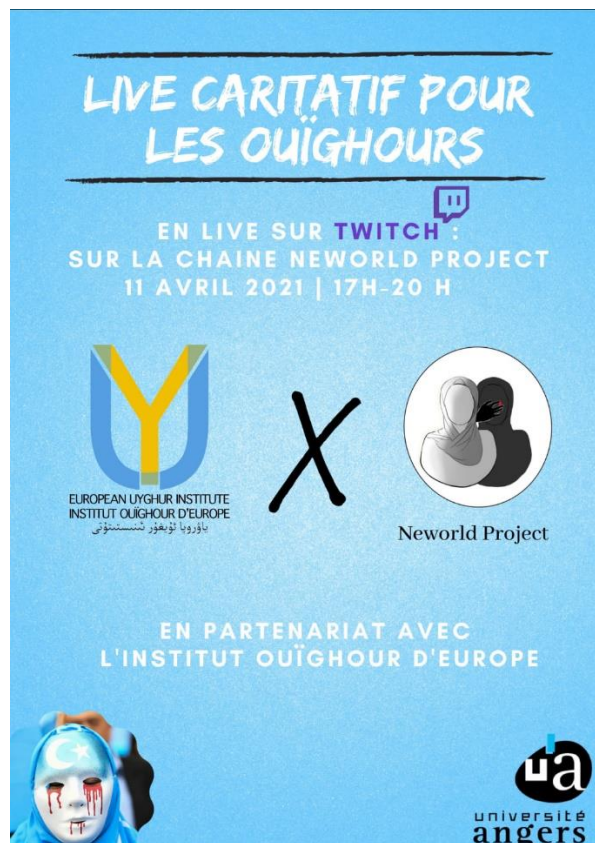
Affiche d'un événement de sensibilisation en ligne organisé par des élèves de l'Université d'Angers avec l'aide de l'IODE

Nous accompagnons aussi les étudiants qui écrivent leurs mémoires ou autres devoirs universitaires à propos de la situation ouïghoure. Que ce soit en accordant des entretiens, en répondant à des questions, en proposant des bibliographies ciblées, nous œuvrons à répondre aux besoins variés des étudiants intéressés.