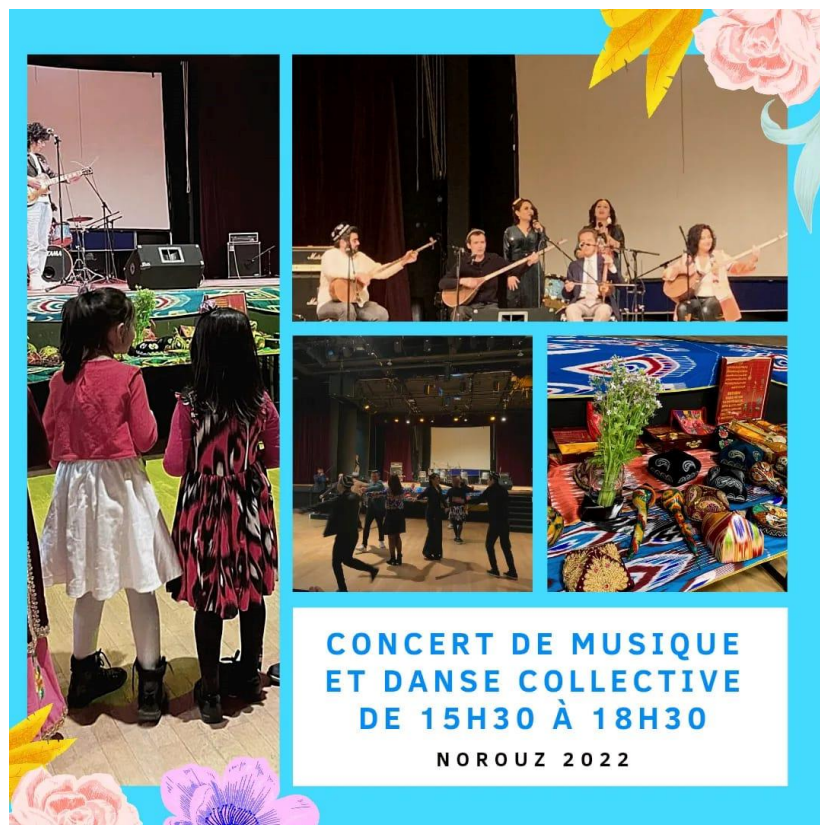
Images de Norouz 2022 à Paris

https://www.youtube.com/watch?v=93QrbZUDodY